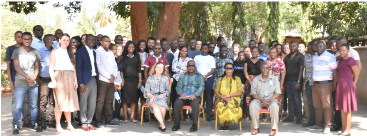
Speaker and participants of the International Summer School in Kenya