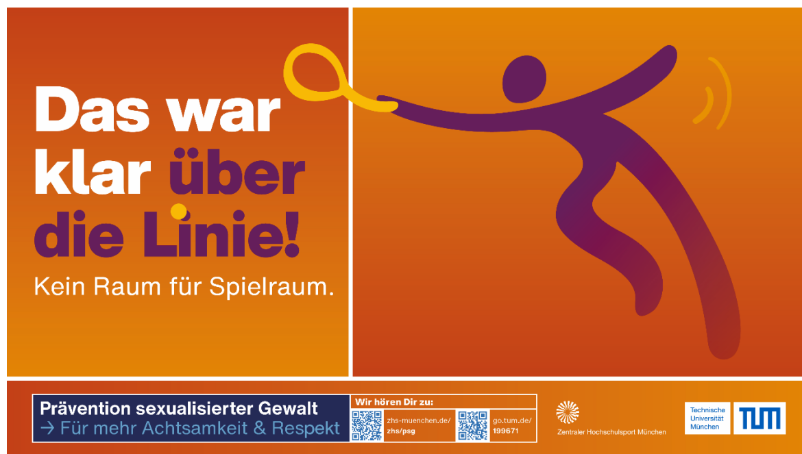
Plakataktion zur Prävention sexualisierter Gewalt im Sport