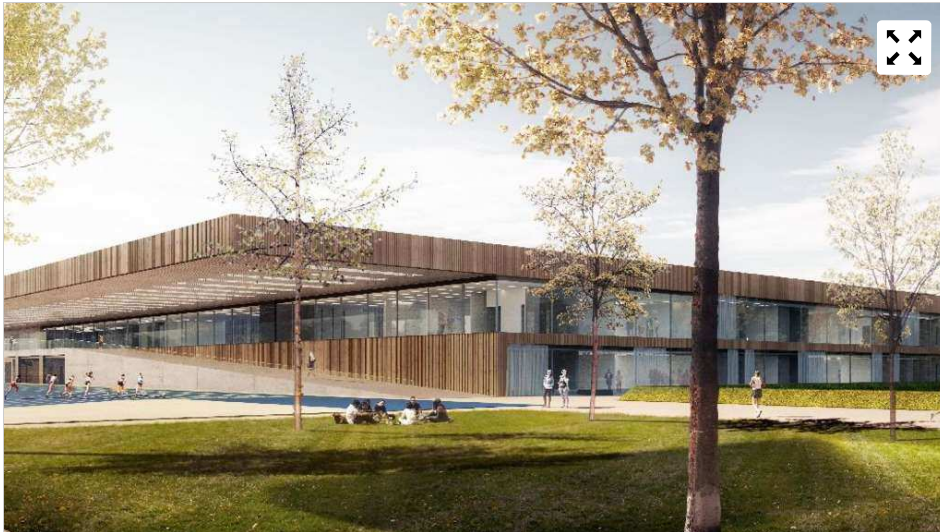
Europas modernster Sportcampus soll bis zum Jahr 2022 im nördlichen Olympiapark entstehen. © Architekturbüro Untertrifaller

Es soll Europas modernster Sportcampus werden: Die Technische Universität (TU) und der Zentrale Hochschulsport (ZHS) errichten im nördlichen Olympiapark ein neues Sportgelände. Dort haben 125 000 Studenten und 30 000 Universitätsangestellte die Möglichkeit, Breiten- und Wettkampfsport zu betreiben. Zu dem Campus gehören außerdem verschiedene Lehr- und Forschungsstätten. „Mit diesem Neubau haben wir beste Chancen, unsere wissenschaftliche Forschung weiter voranzutreiben“, erklärt Professor Ansgar Schwirtz, Dekan der Sport- und Gesundheitswissenschaften. Zu dem Gebäudekomplex gehören sechs Innenhöfe. Die Bauten werden vor allem aus Holz oder Glas errichtet und sollen die Idee einer olympischen Landschaft aufgreifen. „Das neue Sportcenter wird ein in seiner Dimension rekordverdächtiger Holzbau“, sagte Helmut Dietrich vom Architekturbüro Dietrich Untertrifaller. „Eine Bauweise und Architektur als logische Antwort auf die sportliche Aufgabenstellung und den besonderen Ort im denkmalgeschützten Park.“ Die derzeitigen Sportgebäude im Park sind baufällig, eine Sanierung lohnt sich nicht. Der Spatenstich für den Neubau hat bereits stattgefunden, im Jahr 2022 soll das Projekt pünktlich zum 50-jährigen Jubiläum des Olympiageländes fertiggestellt sein. Die Kosten für den Bau betragen 143 Millionen Euro.